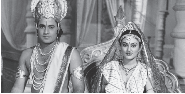
شكل ٤-١: راما وسيتا في معالجة قناة دوردارشان التلفزيونية للملحمة «رامايانا».

هذه القصة الهندية الشهيرة عن راما، التي رويت وتُدكَّرت وأُعيدت روايتها على مدار ما يزيد عن ألفين وخمسمائة من السنين، معروفةٌ لكل الهندوس ولعدد هائل من الناس الآخرين حول العالم؛ يسمعونها الأطفال الهندوس الصغار من آبائهم أو أقاربهم، ويتعلَّمها الأطفال في المدارس عندما يحين عيد ديفالي، ويسمعها القرويون من الرواة أو يَرَوْنها تُعرض على المسرح الشعبي (رامليلا) وفي عروض العرائس، واليوم صار بإمكان مَنْ لديه منهم أجهزة تليفزيون وفيديو تشغيل المسلسلات المفضلة لديهم حول هذه الملحمة وإعادة تشغيلها أكثر من مرة.