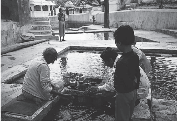
شكل ٢-١: كاهن برهمي يؤدي طقسًا في أحد مواقع الحج.

لها هي الحقيقة أو القانون أو الواجب أو الالتزام. وللدارما استخدام عامٌ واستخدام شخصيٌ. فيجب الحفاظ على تناغم العالم، ويلزم أيضًا الوفاء بدارما الفرد الشخصية. وعمل البرهمن يدعم هذين المتطلبين. ومن خلال أداء طقوس تضحية (ياجنا) مشابهة للطقوس المذكورة في فيدا، يقدم البرهميون قربان للآلهة في النار المقدسة ويلتمسون منهم الحفاظ على العالم الطبيعي وإنزال العطاء على عبادها. بعد ذلك، يؤهل البرهميون الهندوس لأدوار جديدة في مناسك خاصة مرتبطة بدورة الحياة (سامسكارا)؛ فبإعطاء الخيط المقدس في طقس أوبانايانا، يمنح البرهميون صفة «المولود مرتين» للذكور الصغار. وفي الزواج، يربطون الزوج والزوجة معًا، ويؤهلونهما لمرحلة الزواج في الحياة. وفي المناسك المتعلقة بالميلاد، يضمن البرهميون الدخول الصحيح للطفل المولود حديثًا إلى المجتمع، ويساعدون الأسرة في التخلص من الدنس الناجم عن الولادة. وأخيرًا، في المراسم المرتبطة بالموت، يُسهّلون الانتقال السلس للروح، ويتأكدون من خدمة الأسلاف على النحو الصحيح.