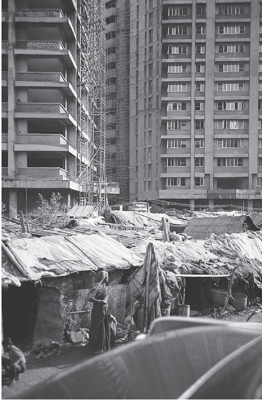
شكل ٧-٢: امرأة من طائفة دنيا تقف بجوار بناية سكنية تحت الإنشاء في بومباي.

«ربة منزل تُنهي حياتها بعد الاعتداء عليها بسبب المهر» (صحيفة «ذا ديكان هيرالد»، عدد ٢٠ نوفمبر ١٩٩٤).