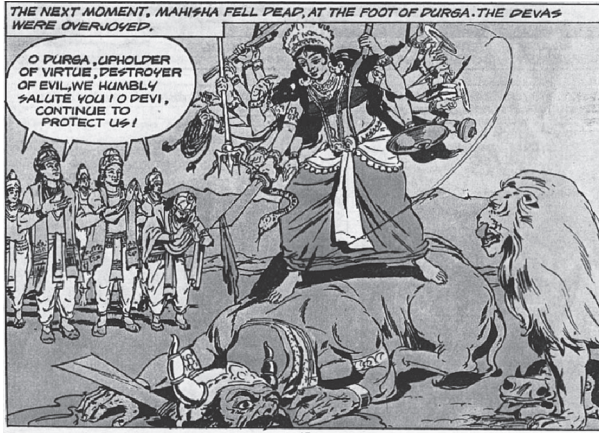
شكل ٤-٢: دورجا تقتل ماهيشا، الشيطان الذي على شكل جاموس.

وعندما يسمع ماهيشا ذلك، يرسل شياطينه لمعرفة ما يحدث، فينقلون إليه الأخبار عن جمال ديفي وخصالها الرائعة، فيرسل لها عرض زواج، فترفضه وتذبح رسله. وعندما يتبعهم ماهيشا، تُعلن عن مهمتها، والتي تتمثل في حماية الدارما. وفي المعركة التي تلي ذلك، يتخذ ماهيشا العديد من الأشكال، لكن ديفي تشرب النبيذ ومن على ظهر أسدها تقتله برمحة الثلاثي وقرصها. ويأخذ الآلهة في الشناء على إنجاز ديفي الكبير.