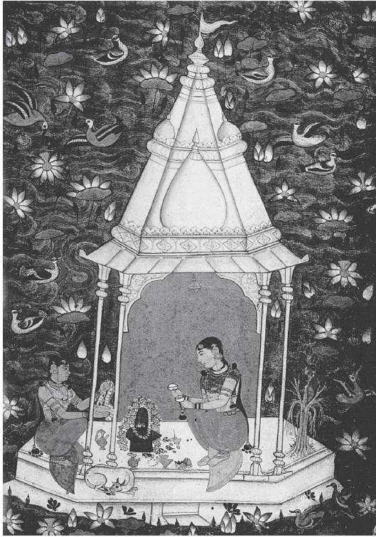
شكل ٧-١: رَسْم لامرأة تتعبَّد عند رمز لشييفا من «راجامالا» مانلي، وهو رسم يعود لعام ١٦١٠ تقريبًا في راجستان.