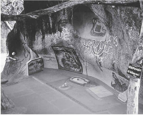
شكل ٥-٢: مزار على جانب الطريق لشيفا وديفي.

المقدسة مقصورة فقط على الأشكال التي كُرِّست للتقديس في مراسم طقسية، وإنما أكد الكثير من علماء اللاهوت الهندوس على قوة وفضل الإله أو الإلهة، وعلى أن هذه القوة والفضل ينعكسان في التصوُّر غير اللاهوتي عن طريق إدراك أن الإله قد يُظهر أو يعطي إشارة في أي وقت لتشجيع تابعيه أو مكافأتهم أو تحذيرهم، أو حتى معاقبتهم. والقصص المذكورة في «بورانا» والتقاليد المحلية والروايات السردية لخبرات الأقارب والجيران تكرر هذه الفكرة وتؤكد عليها.