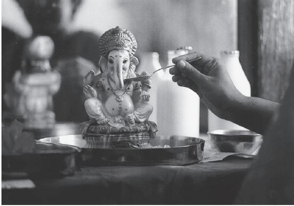
شكل ٥-١: أحد المؤمنين يقدم ملعقة من اللبن لأحد تماثيل الإله جانيشا في «معجزة» سبتمبر ١٩٩٥.

وقد نُحِتَتْ بحبٍّ، لكنها لا تُعْتَبَرُ جديرة بالعبادة سوى في حالات استثنائية فقط. أما الرمز الموجود «داخل» المعبد، فقد أُنْشِئَ ونُصِبَ في عملية طقسية أُعِدَّتْهُ لَأَنْ يسكنه أحد الآلهة. وتُصَفُ النصوصُ الدينيَّةُ الأسلوبَ التأمليَّ للنحّات، ونسب الرمز (والمعبد الذي سيوضَعُ فيه)، وخصائص الإله الذي سيسكنه. وبمجرد أن يُصنَعَ الرمز، يُكْرَسُ كهنة البرهمنية الصورة للتقديس، ويضعون عدة آلهة في أماكن مختلفة من جسم الرمز، ويبثون فيه نفساً حياً (برانا). وبدءاً من تلك اللحظة، يتجلى الإله في الرمز ويجب الاعتناء به، وخدمته كضيف مُكْرَّم، ومنحُه الحب. ويصير بعد ذلك من الممكن وجود علاقة متبادلة وثيقة بين المُتَعَبِّدِ والإله من خلال الرؤيَّة (دارشاننا)؛ فيزور الهندوس معابدهم المحلية أو يقومون برحلات إلى أماكن حجٍّ أبعد ليؤدوا «الدارشاننا»؛ أي ليرَوْا كريشنا أو ديفي أو شيفا أو أيَّ إله آخر يختارونه، ويراهم هذا الإله.