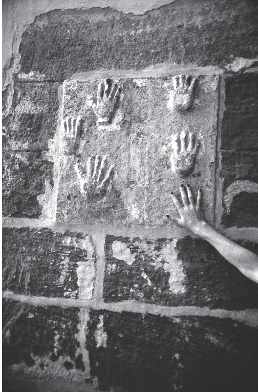
شكل ٦-٢: بصمات أيدي الساتي: نصب تذكاري للسيدات اللاتي حُرقت حَيَاتٍ في محارق أزواجهن الجنائزية.

تلك القِيمَ تأييدًا إيجابيًا، فقد كان لهم ردُّ فعلٍ مناهض لها؛ على سبيل المثال، أعادت حركة آريا ساماج الهندوس الذين ينتمون للطوائف الدنيا، الذين اعتنقوا المسيحية، إلى الهندوسية. وقام الكثير من الجماعات الجديدة بمحاكاة ممارسات المجتمعات البريطانية وهياكلها التنظيمية والإدارية، واستخدمت الكلمة المطبوعة مثل رام موهان روي كوسيلة لنشر أفكارها.