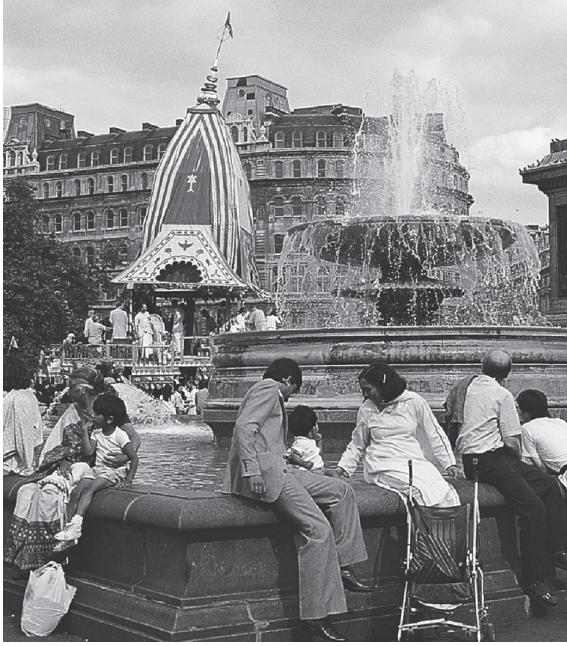
شكل ٨-٢: مسيرة «راثا ياترا» في ميدان ترافالجار نظمتها الجمعية الدولية للوعي بكريشنا.

ومقارنتها بالأديان العالمية الرئيسية الأخرى، والآخر: هو رغبة العديد من الهندوس في التأكيد على انفتاح الهندوسية تجاه الأديان الأخرى وتنوع السبل داخلها. وتدعم منظمة فيشوا هندو باريشاد المطلب الأول، وتعمل بنشاط في أنحاء العالم للترويج للهوية الهندوسية («هيندوتفا») وشعور بالفخر بين الهندوس. على الجانب الآخر، طرح عدد من الباحثين والكتّاب الهندوس والجماعات النسائية الهندوسية خارج الهند وجهة النظر المعارضة القائمة على فكرة الاختلاف الديني والثقافي، التي ترى أن فكرة وحدة الهندوسية لا علاقة لها بالتاريخ، ولا فائدة لها فيما يتعلق بتمكين الهندوس من العيش بإيجابية مع معتنقي الأديان الأخرى، بل ومع من ينتمون لمجتمعهم الإيماني نفسه ممن لديهم وجهات نظر مغايرة.