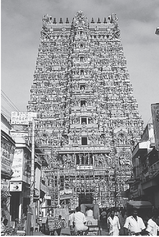
شكل ٥-٤: معبد ميناكشي في مدينة مادوراي.