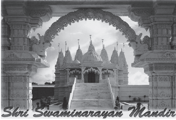
شكل ٨-١: بطاقة بريدية توضح معبد شري سواميناريان ماندير الهندوسي في نيزدين.

وبرنامج السنياسيين الجدد الذي أسسه بهاجوان راجنيش (المعروف أيضاً باسم أوشو)؛ والساهاجا يوجا التي أسستها ماتجي نيرمالا ديفي؛ وإينجار يوجا. تدرك كل هذه الحركات، بالإضافة إلى جماعات العضوية المختلطة، اهتمام الغربيين بجوانب الروحانية الهندوسية، لا سيما إنشاد المانترا، وتأمل الكونداليني، والهاثا يوجا، والإيمان بالتناسخ، وأتباع نظام غذائي نباتي. وقد ظهرت هذه الحركات في الغرب في الوقت المناسب؛ إذ ساعدت على ملء الفراغ الروحي وتقديم أفكار وممارسات لمن يسعون إلى بدائل للأديان الغربية والعلمانية.