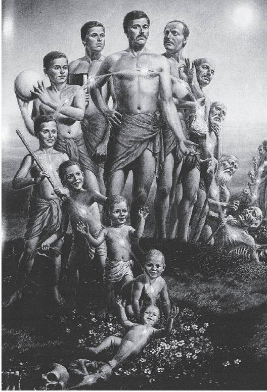
شكل ٣-١: تناسخ الذات.

لكن رَدَّ كريشنا جاء عاليًا وواضحًا: «لا يتحرر الإنسان من نتائج العمل عن طريق الامتناع عن العمل نفسه، ولا يصل إلى الكمال بنبذ العمل.» ويواصل كريشنا حديثه موضِّحًا أن ما يجب نبذه هو نتائج العمل، وليس العمل نفسه؛ فيجب ألا يرغب الإنسان في مكافآت معينة، وألاَّ يفتخر بنفسه بوصفه فاعلاً لأُمور عظيمة. ويجب أن يكون المرء راضيًا عن نفسه، ويقدم العمل ونتائجَه كقربان للإله. وهذا هو أدب الكارما يوجا. وبعد أن علَّم كريشنا أرجونا ذلك، يشرح له سبلاً أخرى جيدة يمكنها — إن اتُّبعت باستمرار — أن تمنح أيَّ باحث الرزانة، والتحرر في نهاية الأمر. ولقد ركَّز كريشنا — الذي اتضح