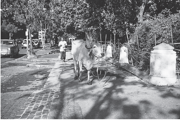
شكل ٩-١: مشهد لشارع في بومباي.

نفسه؟ سوف أقدم هنا استعارة قد تساعدنا على تأمل الطبيعة المتنوعة للهندوسية والدور المهم الذي تلعبه السلطة في تكوينها. وختامًا، سأعود إلى البقرة وعلاقتها بماضي الهندوسية وحاضرها لأوضح أن معنى «الهندوسية» خاضع للنقاش المستمر.